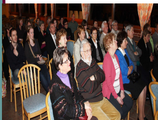
La soirée du 10 novembre aux Vergers Telliers