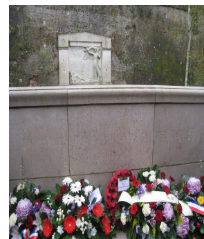
Le monument des Néo-Zélandais le 11 novembre 2009

Aurons-nous la chance de voir le spot publicitaire lors d'une séance ciné du « Théâtre des 3 chênes » ?