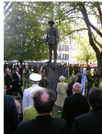
Statue d'H-J Nicholas à Christchurch