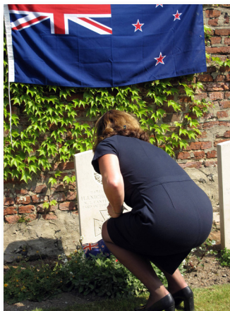
Cimetière de Vertigneul

Après le vin d'honneur offert par la municipalité, l'association Le Quesnoy - Nouvelle Zélande a proposé le pique-nique avant d'inviter ceux qui le désiraient à revisiter les lieux des combats d'octobre 1918.