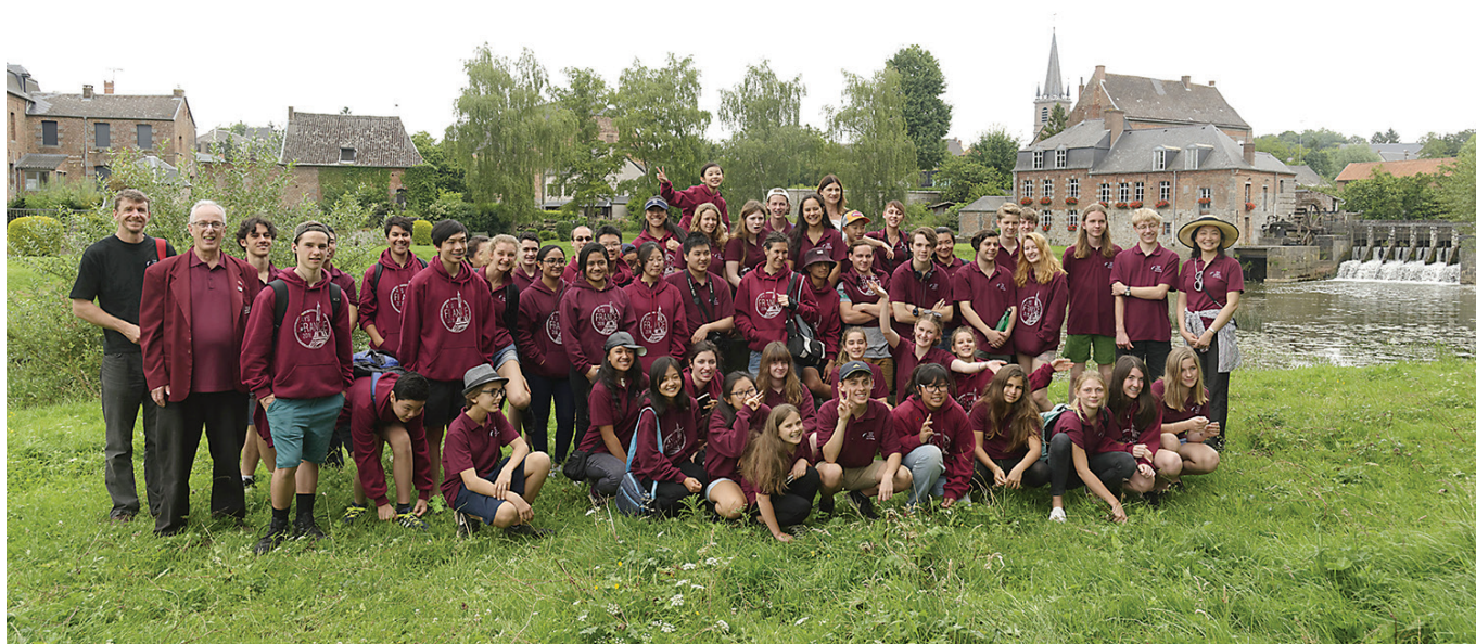
L'orchestre symphonique AOTEA à Maroilles et le New Zéland YOUTH Choir au mémorial du Quesnoy

On pourra s'acquitter, ce 18 mars, du paiement de la cotisation 2017 dont le montant a été fixé à 17 euros par un vote du Conseil d'administration.