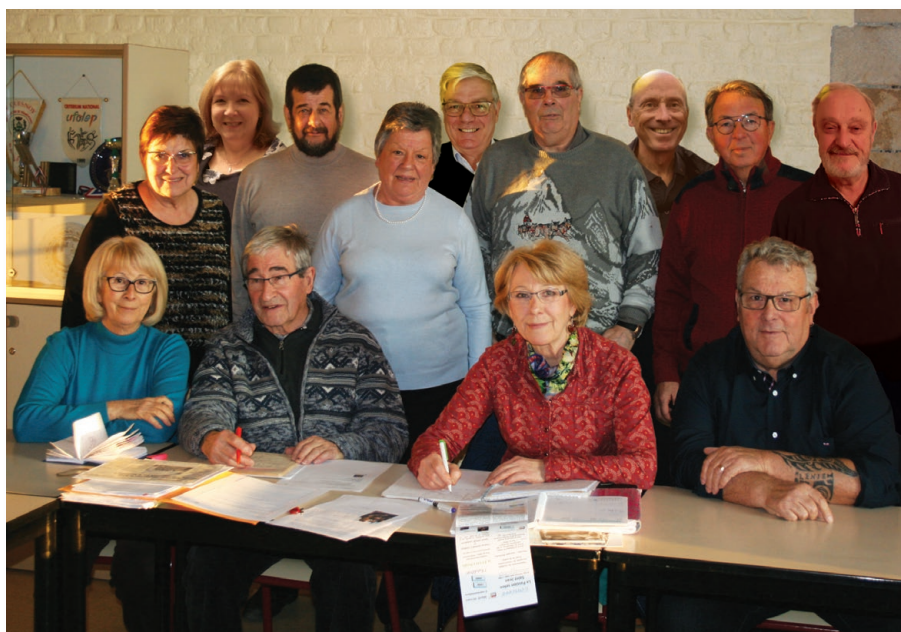
Les membres du conseil d'administration lors d'une séance de travail

Cette année, nous vous invitons à découvrir le nouveau musée dédié aux troupes australiennes ; il est situé à Villers-Bretonneux, près d'Amiens. En principe, la date retenue est le samedi 28 septembre. A vos agendas !