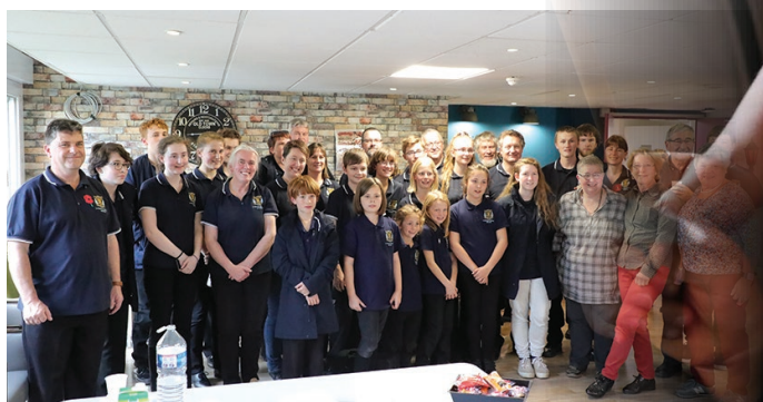
Maison de retraite Vauban